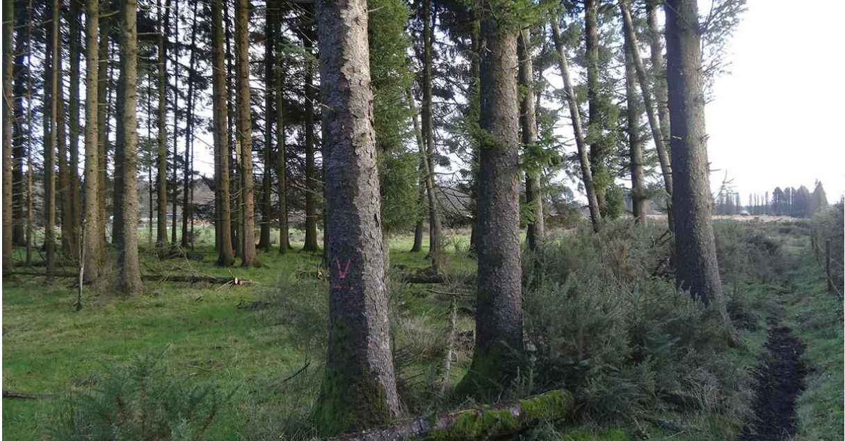
Figure 2 : Plantation de résineux

Avec un budget de 1 647 910 € sur 5 ans (2021-2025), le programme LIFE va permettre d'engager un panel d'actions pour restaurer et préserver les landes et tourbières d'Armorique : désenrésinement de certaines parcelles, gyrobroyage d'ouverture suivi d'une mise en gestion par fauche ou pâturage, comblement de drains, aménagement de sentiers pour assurer un meilleur accueil du public et limiter les impacts sur la végétation et l'avifaune nicheuse.